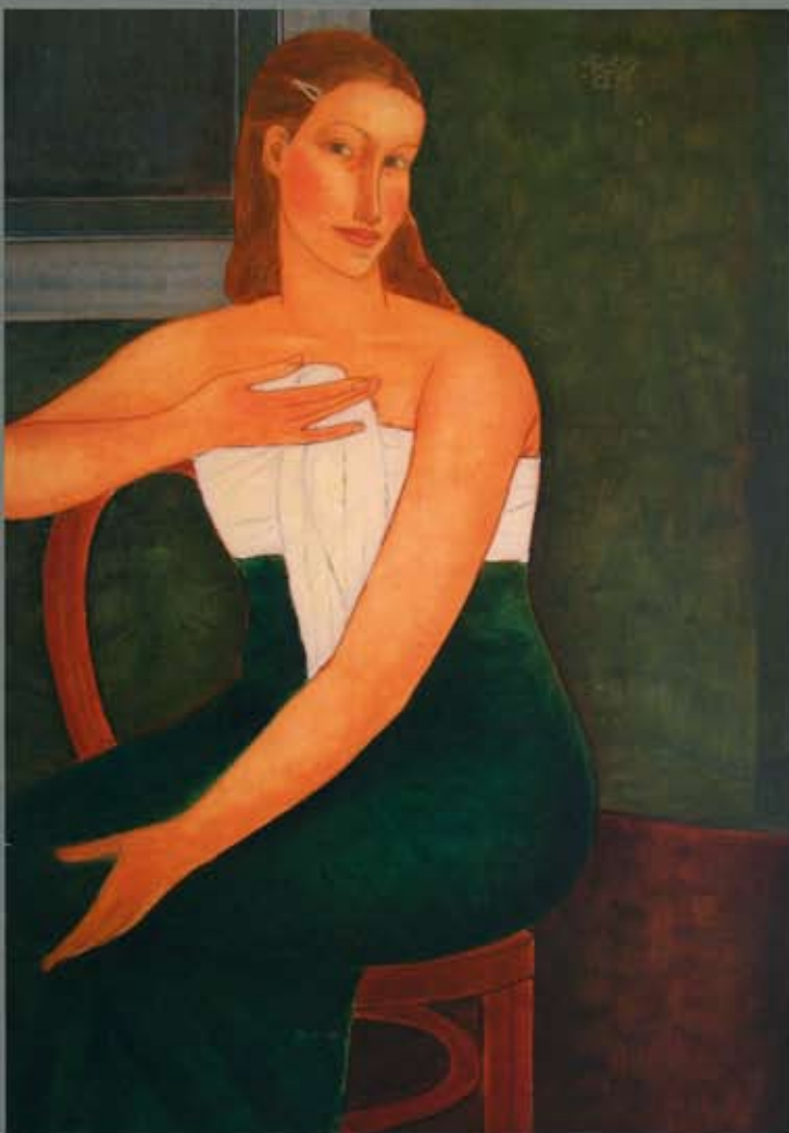
2008 • olieverf op doek • 120 x 80 cm